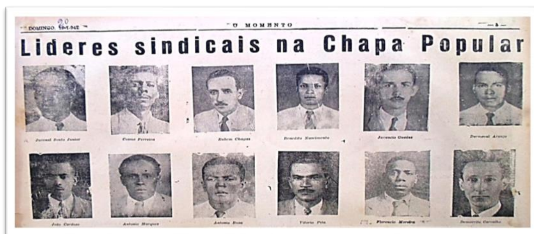
Sindicalistas candidatos a deputados estaduais pelo PCB nas eleições de 1947. ( O Momento , 20 jan. 1947)