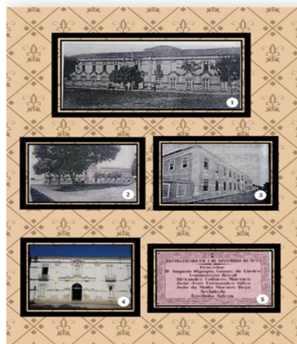
IMAGEM 7: ÁLBUM (CASA DOS EXPOSTOS)