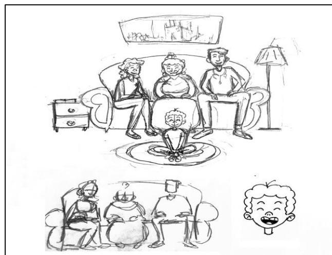
IMAGEM 2: RASCUNHO (PERSONAGENS)

Como se trata de um conto infantojuvenil, é imprescindível que ele possua ilustrações para ajudar no entendimento da narração e também para chamar atenção do leitor para a obra. Dessa forma, foi necessário a utilização do trabalho de um designer-illustrador, para a elaboração das ilustrações e diagramação do conto. Após essa etapa foi descrito como seriam os personagens como cor de pele, estatura, vestimentas, acessórios e cenário de cada ilustração.