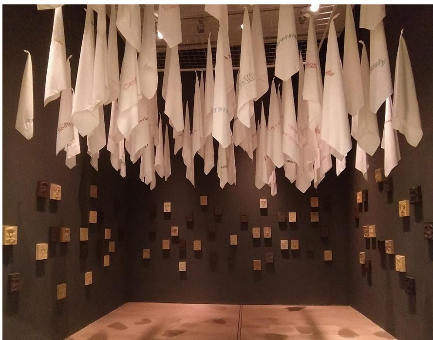
Figura 2 - Instalação "Las locas (el amor se hace revolucionário)". MALBA, Buenos Aires - Argentina, 2023.

A instalação “Las locas (el amor se hace revolucionário)” faz parte da exposição “SCHHHIII...” de Anna Maria Maiolino, organizada pelo Instituto Tomie Ohtake com a curadoria de Paulo Miyada, que esteve em cartaz no MALBA (Museu de Arte Latinoamericano de Buenos Aires) entre 07 de outubro de 2022 e 20 de fevereiro de 2023, seguindo uma exposição anterior em São Paulo. Trata-se de uma exposição antológica da obra da artista que abrange mais de 50 anos de produção em diferentes suportes. (MALBA, 2023)