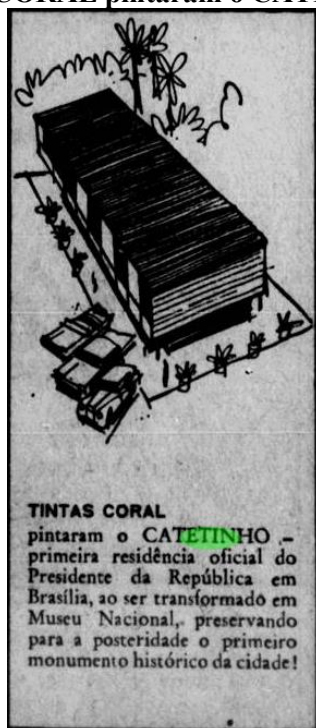
Figura 3: “TINTAS CORAL pintaram o CATETINHO 1960