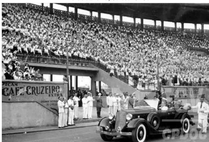
Figura 4 - Getúlio Vargas no Desfile da Juventude, Campo do Vasco da Gama. Rio de Janeiro, 07 set 1943.