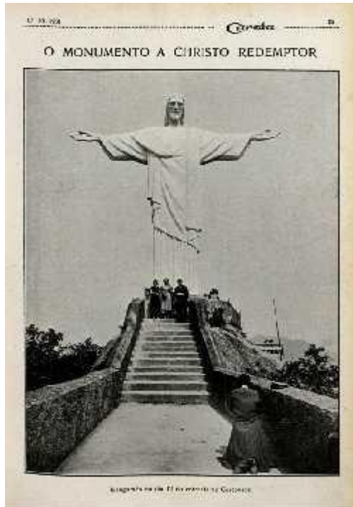
Legenda da foto: Inaugurado no dia 12 do corrente no Corcovado