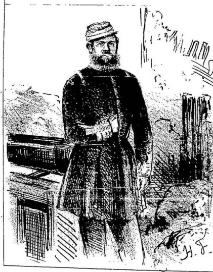
O CORONEL PARAGUAYO