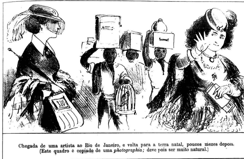
Chegada de uma artista ao Rio de Janeiro, e volta para a terra natal, poucos mezes depois. (Este quadro é copiado de uma photographia ; deve pois ser muito natural)

A segunda imagem nada tem a ver com o conflito armado. Nela, vemos uma artista chegando ao Rio de Janeiro (canto esquerdo) e depois indo embora da cidade (canto direito), tendo sua bagagem carregada por três negros. A ideia que se quer destacar aqui é a consideração da fotografia como uma representação natural, imbuída de veracidade e fidelidade com o real, e a necessidade de enfatizar isso para o público leitor.