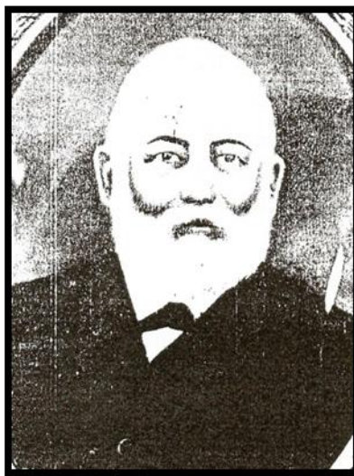
FIGURA 2: retrato de Coronel Jacob Selbach (DIAGNOSE, 1991:9)

A forma como ocorreu a colonização oficial do atual município de Selbach é bem específica. Durante a República Velha (1897), o então Coronel Jacob Selbach Júnior (amigo do então governante do RS, Júlio de Castilhos; e membro ativo do PRR – Partido Republicano Riograndense) adquiriu terras do Governo Federal, iniciando-se, em seguida, o núcleo de colonização em Carazinho (1905).