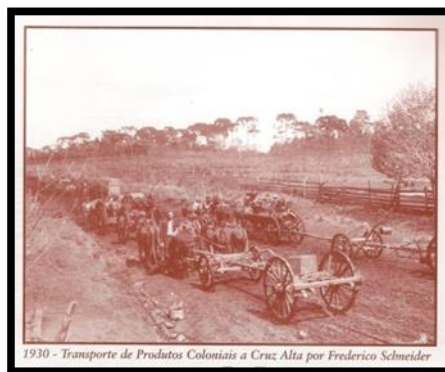
FIGURA 6: Transporte de produtos coloniais. (SELBACH, 2003: março)

Segundo João Carlos Tedesco e Liliane Wentz: