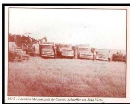
FIGURA 8: Mecanização da lavoura. (SELBACH, 2003: setembro)

As famílias que permanecem labutando no campo diminuíram também em virtude do êxodo rural, o que é comprovado pelo último censo demográfico, conforme tratado anteriormente.