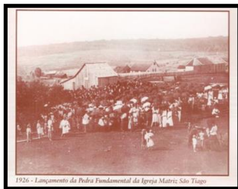
FIGURA 4: demonstração da fé católica. (SELBACH, 2003:janeiro)

A área de terras hoje pertencente ao município em questão foi de Passo Fundo (até 1924), de Carazinho (de 1931 a 1954), e de Tapera (até 1964, quando iniciaram os movimentos em prol da criação de Selbach). Em 1965, através da Lei Estadual nº 5036 de 22 de setembro: