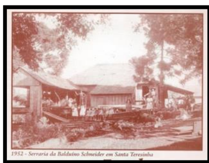
FIGURA 7: Retrato de uma serraria. (SELBACH, 2003: junho)

Já nas décadas seguintes, a agricultura foi se desenvolvendo e novas formas de produzir a lavoura, com técnicas inovadoras, foram incentivadas. Porém, a terra tornou-se pouca porque a população aumentou. Ocorreu aí, uma nova migração: de selbachenses para os estados de Santa Catarina e Goiás, onde o preço possibilitava que o colono adquirisse maior quantidade de terras por menos valor.