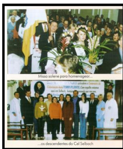
FIGURA 3: registro da missa em homenagem à família do colonizador. (SELBACH, 2008:5)

Ainda é interessante citar, além do monumento, a homenagem realizada em 2008, na passagem dos 42 anos do município, durante uma celebração religiosa na igreja matriz, aos descendentes do Coronel, quando os mesmos receberam troféus com o símbolo da Blumenfest, em “gradidão” a colonização: