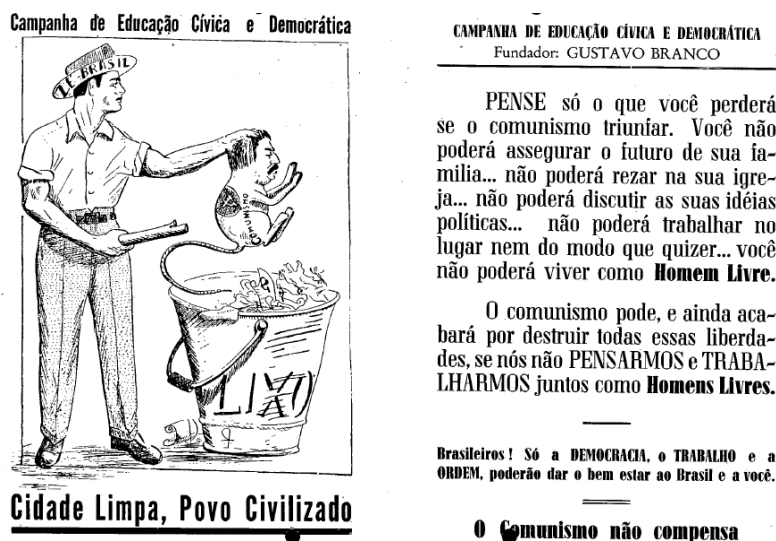
Figura 2 - Panfleto da Campanha de Educação Cívica e Democrática . Fonte: (DEAP, [1951?b], Pasta 786a.92, p. 114).

Os escritos do panfleto apelam para os prejuízos que o bolchevismo pode causar na família, na religião e no comprometimento da liberdade: “Pense só o que você perderá se o comunismo triunfar. Você não poderá assegurar o futuro de sua família... não poderá trabalhar no lugar nem do modo que quiser [sic] ... você não poderá viver como Homem livre ” (DEAP, [1951?b], Pasta 786a.92: 114, grifo do autor). Os dizeres, assim como a ilustração, estão voltados para uma pedagogia anticomunista, alimentada pelo temor do triunfo do bolchevismo (conspiração) e a ameaça da perda de valores sociais. A união de todos, como conclama o documento, seria imprescindível para a manutenção da ordem e eliminação de quem não a aceitasse.