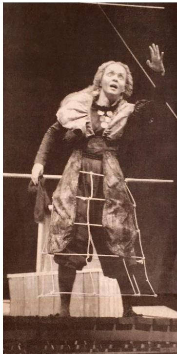
A Notícia . Joinville, 21 nov. 1999

A cena abaixo apresenta uma Rainha de gestos suaves, delicados e muito educados. A personagem se encontra aos 26 anos de idade, na cena que leva ao seu casamento. É a cena II do texto, apontando como o responsável por esse momento doloroso de sua vida o Sr. Sebastião José de Carvalho Melo, ou o conhecido como Marques de Pombal.