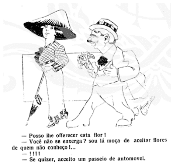
Figura 2- Fon-Fon. 1 de fevereiro de 1913.

A charge acima representa a mulher como interesseira e com valores “invertidos”, pois ela prefere passear de carro, do que receber uma flor. Como já destacado, a Fon-Fon , constantemente criticava as jovens que queriam se modernizar demais, como por exemplo; o uso das jupes-cullotes (um modelo de calça comprida feminina), que neste período causou muito espanto e preocupação. Havia uma campanha para que essa moda não fosse adotada no Brasil, por ser uma vestimenta considerada masculina, e sua utilização era vista como uma forma de protesto e constantemente associada ao movimento feminista. Na coluna “Pequenas Notas” podemos notar este incômodo: