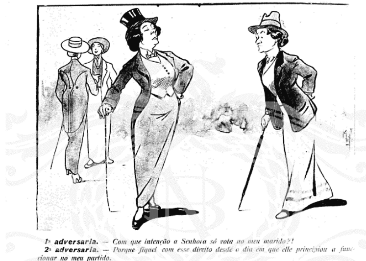
Figura 4: Fon-Fon , 4 de outubro de 1913.

Na charge, percebemos que as mulheres representadas como sufragistas, estavam interessadas em outros assuntos, como o de roubar o marido da outra, mas nunca com interesses reais na política. É possível notar também, que a moda do início do século XX seguia a mesma lógica iniciada um século antes, ou seja, pautada na diferença entre as roupas de homens e mulheres, consequência da divisão de tarefas e de possibilidades destinadas a cada gênero. As mulheres que aderiram a moda das jupes-cullotes , como enfatizamos anteriormente, queriam se afastar da obediência às normas comportamentais do feminino, transmitidas pela Fon-Fon . Então, mais do que uma simples estética da moda, onde as mulheres teriam que optar por aderir ou não ao uso das calças, utilizar a nova moda seria concordar com as ideias do feminismo. Por isso, como mostra uma coluna escrita supostamente por uma mulher chamada Madame Nascimento 2 , poucas mulheres aderiram à moda das jupes-cullotes . A coluna, ao mesmo tempo, afasta as leitoras de possíveis ideias feministas: