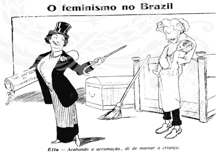
Figura 1- Fon-Fon. 1 de junho de 1912

Notamos então, que as mulheres permaneciam com muitas restrições de comportamento e atuação social. Mas, então, como era identificada a mulher moderna do início do século XX? Essas mulheres estavam participando da vida social, eram as que já trabalhavam fora de casa, transitavam pelas ruas, frequentavam cinemas, teatros, bailes e praticavam esportes, ou seja, estavam se modernizando junto com a cidade do Rio de Janeiro. Porém, as mesmas são representadas pela Fon-Fon como fúteis, preocupadas apenas com a aparência, os flirts 1 e a ostentação, como sugerem a charge a seguir: