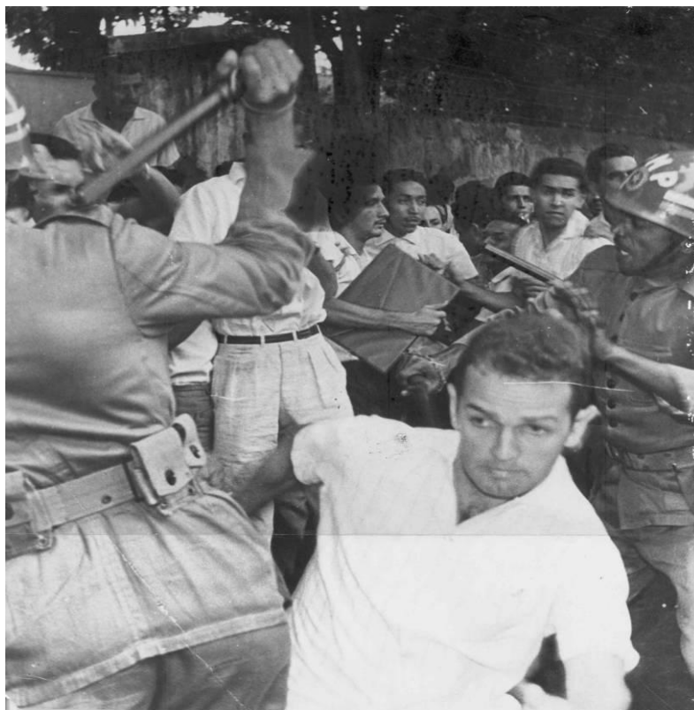
Imagem 02 Ação repressiva da polícia durante a realização de uma manifestação estudantil em Recife, sem data 2 .

O diagrama da repressão é bastante elucidativo acerca da estrutura e atuação do DOPS-PE, apresentando como essa instituição estava ligada à Secretaria de Segurança Pública do Estado e ao SNI, tendo como eixo central de suas atividades a censura, investigação e repressão a diversos segmentos sociais, entre eles: o Movimento Estudantil. Várias atividades também foram combatidas pela polícia, como foi o caso das pichações das e panfletagens, comuns entre os estudantes.