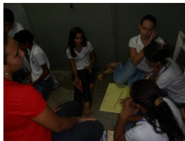
Foto 1: Bolsista de Iniciação à docencia dando inicio as discussões em grupos menores.

Na seqüência propomos que os educandos efetuassem a tarefa sentados no chão, para facilitar assim o trabalho dos mesmos.