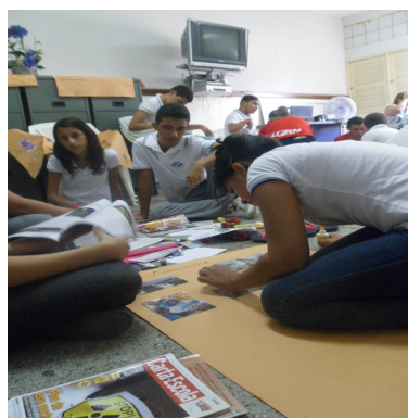
Foto 4 : Os alunos do sétimo ano dando início a produção de cartazes que envolvessem as discussões geradas em sala. Disponível nos Arquivos do PIBID – História 2013