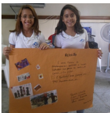
Foto 7: Conclusão da oficina com cartazes produzidos pelos alunos do sétimo ano.

Todos se mostraram bastante interessados, apesar de todos os imprevistos, citados anteriormente, fizeram perguntas e participaram da execução da oficina, enquanto viam imagens e ouviam músicas que se associavam a várias religiões, dentre elas, cristã, espírita, indígena, budista, islâmica, matriz africana o que tornou a oficina ainda mais agradável.