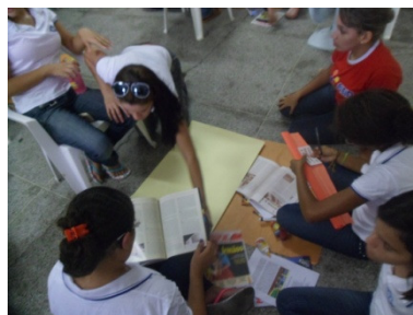
Foto 2: Bolsista de Iniciação à docencia dando inicio as discussões em grupos menores.