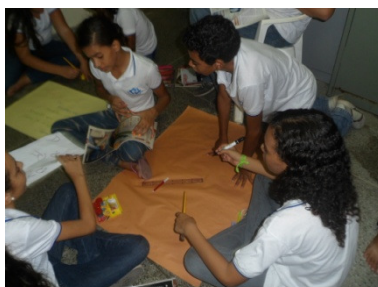
Foto 5 : Os alunos do sétimo ano dando início a produção de cartazes que envolvessem as discussões geradas em sala.