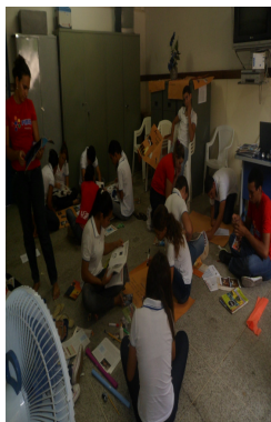
Foto 3 : Bolsistas de Iniciação à docencia dando início as discussões em grupos menores.