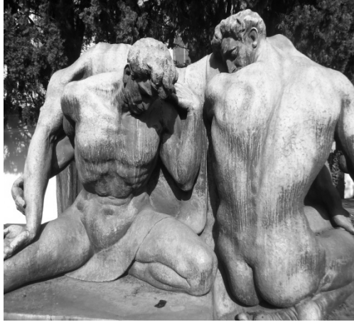
Figura 4 Túmulo da Família Giannini Alfredo Oliani Acervo pessoal da autora Necrópole São Paulo – SP 2011