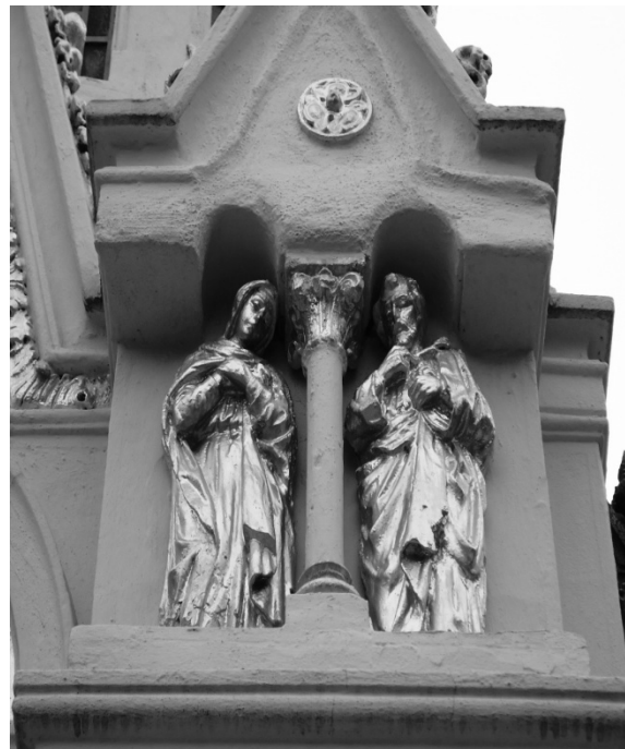
Figura 2 Detalhes com a estatuária cristã Autoria: Viviane Comunale Cemitério do Brás 2010 Acervo das autora