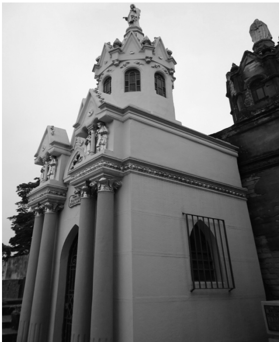
Figura 1 Vista lateral da Capela Cemitério do Brás 2010

Para exemplificar tomamos como base o cemitério Père Lachaise, em Paris que logo após benção do campo e a sua abertura oficial, começam a edificar capelas com símbolos católicos e com santos como uma forma de túmulos. Esse tipo de construção se espalhou pelo mundo e reafirmou a presença do sacro nesse novo espaço.