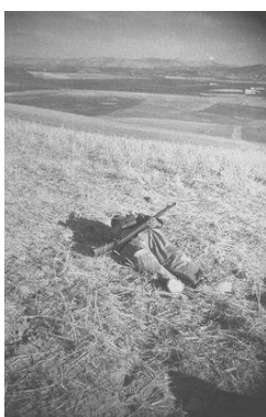
Img. 1. Robert Capa. Soldado miliciano caído. Espanha, 1936.