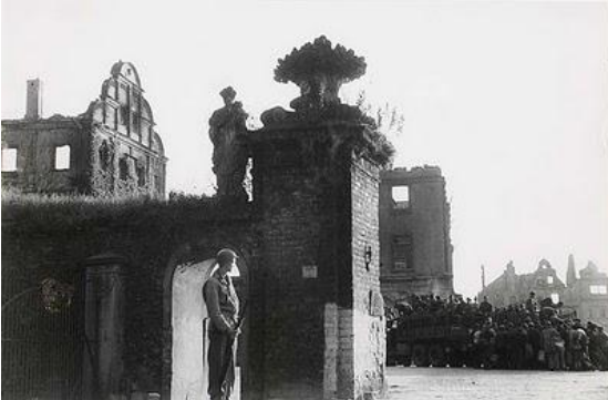
Img. 7. Henri Cartier-Bresson. Reconhecimento de informante da Gestapo. Dessau, Alemanha, 1945.