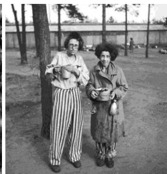
Img. 10. George Rodger. Campo de Bergen-Belsen. Alemanha, 1945.