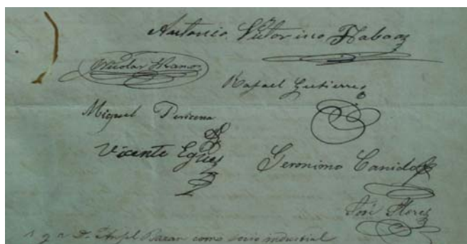
Imagem 1 - Assinaturas dos membros pioneiros da Sociedad Progresista de Bolivia 11 .