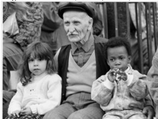
Imagem 13 – Hanover, 1986 (KURT, 1999:101)

Imagens que retratam sempre os díspares, porém diferentes que convivem em harmonia (Imagens 9, 10, 11, 12, 13). Diferenças geracionais, culturais, de cor de pele ou de posição social. Todos eles diferentes que se gostam e se relacionam. Ao observar tais imagens percebo suas semelhanças com os espaços percorridos por Kemal Kurt. Veio de Çorlu, na Tráquia, região onde indivíduos de diferentes origens convivem. Morou em Istambul, a ponte entre Oriente e Ocidente. Mais tarde, se estabeleceu em Berlim, cidade que, por mais de