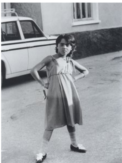
Imagem 4 – Çorlu, 1981 (KURT, 1999:61)

deixando fotografar (Imagens 4, 5, 6, 7, 8). Trata-se de uma história que passa pelos camponeses, pelos ciganos, pelos políticos, pelos idosos, pelas crianças. Uma história que vai além da Turquia e da Alemanha e que é multicolorida. Uma história de pessoas ( Menschen ) e de lugares ( Orte ). Uma história de lugares de pessoas ( Menschenorte ) e dos lugares das pessoas ( Orte der Menschen ). Por fim, uma história também de pessoas em lugares ( Menschen in den Orte ).