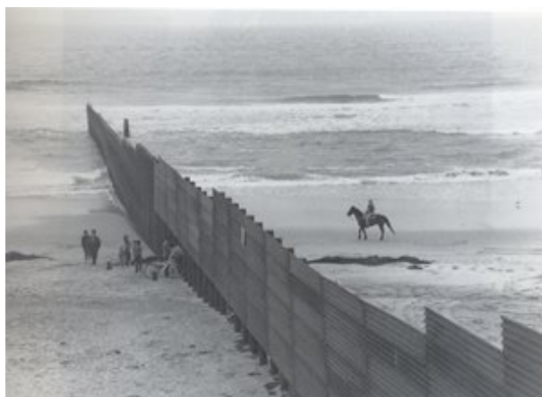
Imagem 14 – Tijuana, 1999 (KURT, 1999:151)

Kurt prossegue em sua descrição do mundo tratando das fronteiras existentes, as quais sempre têm dois lados – como mostra a foto que também é capa do livro (Imagem 14). Sua existência desconstrói qualquer idéia de liberdade, seja de qual lado se esteja. “Abaixo às fronteiras”, diz ele. E relata seu sonho, propondo um novo projeto de mundo: um mundo em festa, com muita mistura e convivência entre diferentes, onde é possível festejar a vida.