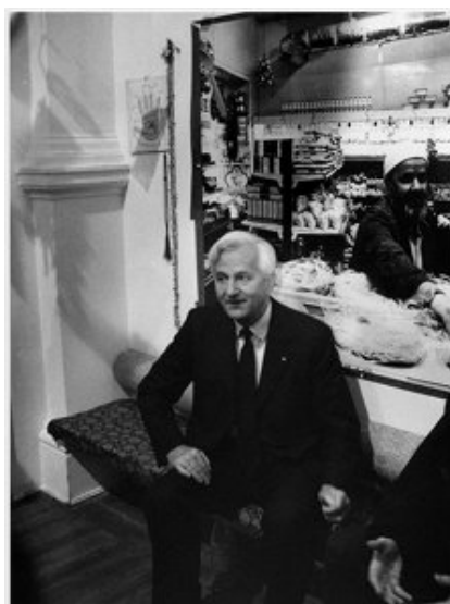
Imagem 7 – Berlim, 1984 (KURT, 1999:141)