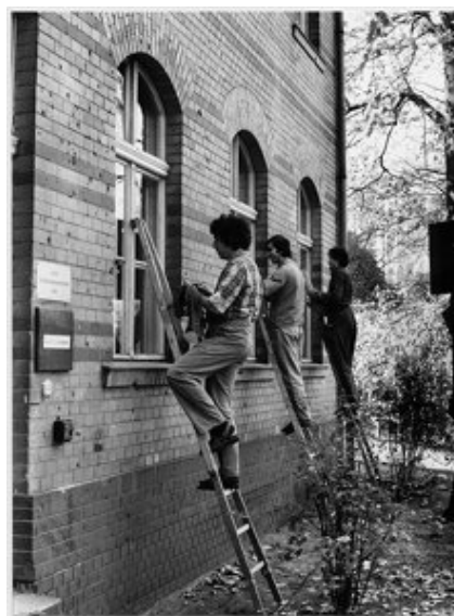
Imagem 2 – Berlim, 1980 (KURT, 1999:81)

Na imagem 1, produzida nas dependências de uma multinacional de eletroeletrônicos ( AEG ), Kurt apresenta um trabalhador, de origem turca trabalhando junto ao rotor de uma máquina de grande porte. Além das luvas, não utiliza nenhum outro equipamento de proteção. Na imagem, percebe-se a valorização da indústria e da máquina, que vem à frente, enquanto o operário vem no último plano. A ele eram destinados o serviço braçal, a graxa, o ruído que danifica os tímpanos e as substâncias tóxicas que contaminam.