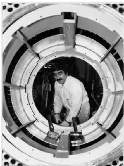
Imagem 1 – Berlim, 1981 (KURT, 1999:82)