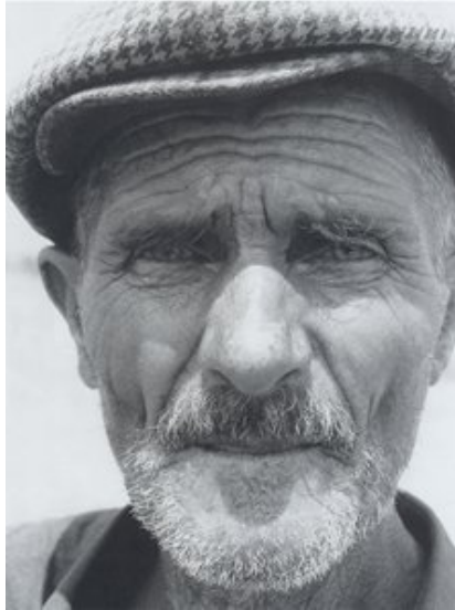
Imagem 8 – Malkara, 1984 (KURT, 1999:148)

Mas em terra estrangeira o imigrante nem sempre é bem-vindo. Vive decepções e tristezas ao constatar uma sociedade local não amigável. Nesse contexto, os excluídos desempenham papéis de subserviência. É disso que tratam as próximas poesias, enquanto as fotografias que as acompanham apresentam um outro quadro.