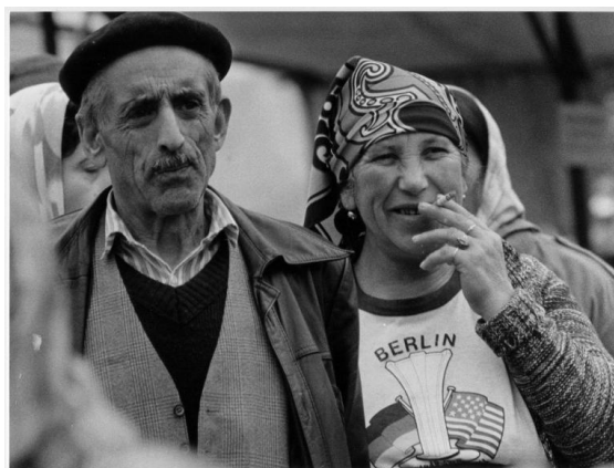
Imagem 11 – Berlim, 1986 (KURT, 1999:76)