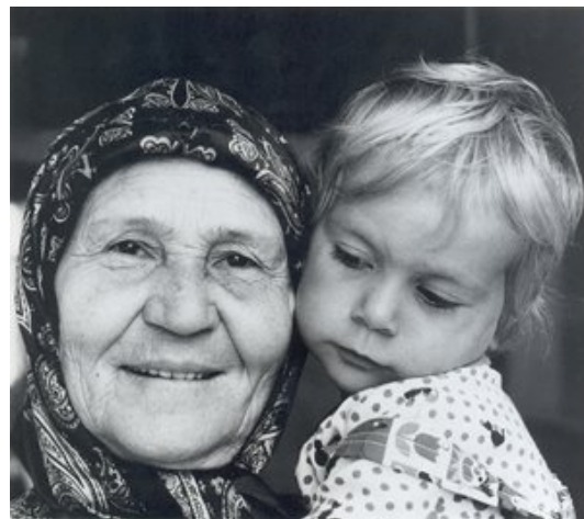
Imagem 10 – Çorlu, 1981 (KURT, 1999:69)