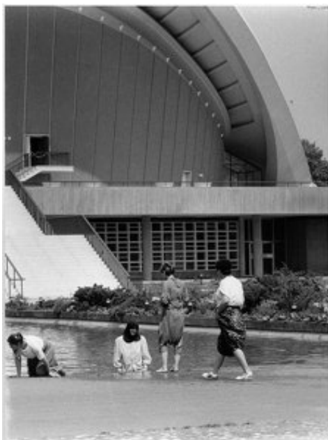
Imagem 9 – Berlim, 1987 (KURT, 1999:39)