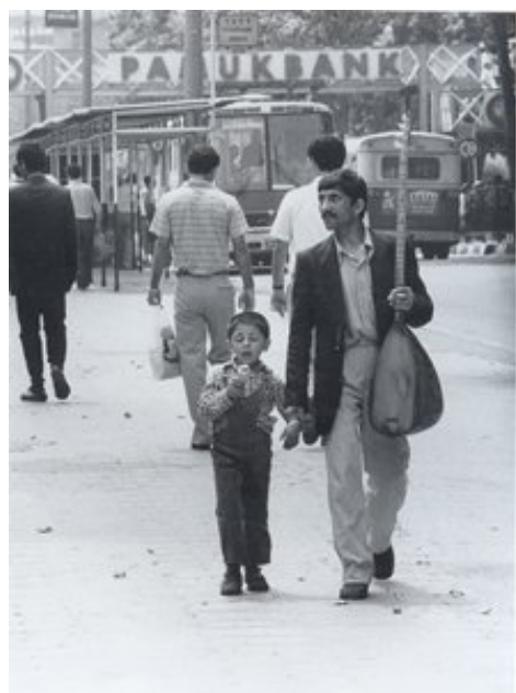
Imagem 12 – Istambul, 1986 (KURT, 1999:99)