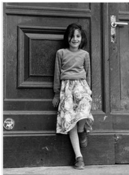
Imagem 5 – Berlim, 1986 (KURT, 1999:89)