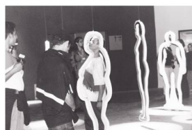
Classificações Científicas da Obesidade Balaio Brasil - SESC Belenzinho São Paulo - dezembro de 2000