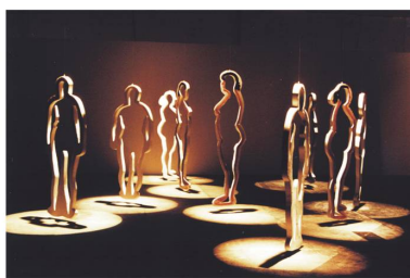
Classificações Científicas da Obesidade Brasil - SESC Belenzinho São Paulo - dezembro de 2000

Neste mote, Magalhães afirma que o discurso médico promove uma limpeza nos espaços urbanos e nos corpos que pretende um “desengorduramento” de tudo. Esse corte ao corpo gordo, defendido pelo discurso médico, associa a obesidade à morbidez, à sujeira e ao asco. Essa higiene visa, para a artista, a imposição de uma norma, de uma padronização que acaba por cegar através do excesso e proliferação de imagens na mídia.