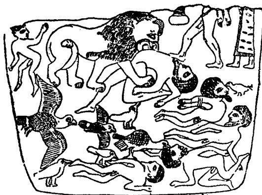
Fig. 1. — O rei-leão devora seus inimigos (Apud Moret, Le Nil ... , pág. 133).